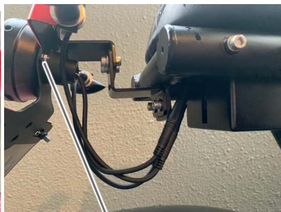
テールランプ固定ナット(左右1個ずつ)