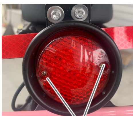
テールランプ固定ネジ

テールランプ裏側のナットをレンチ、ペンチなどで抑えつつテールランプにある二つのネジを+ドライバーで緩めてテールランプ部品を外してください。